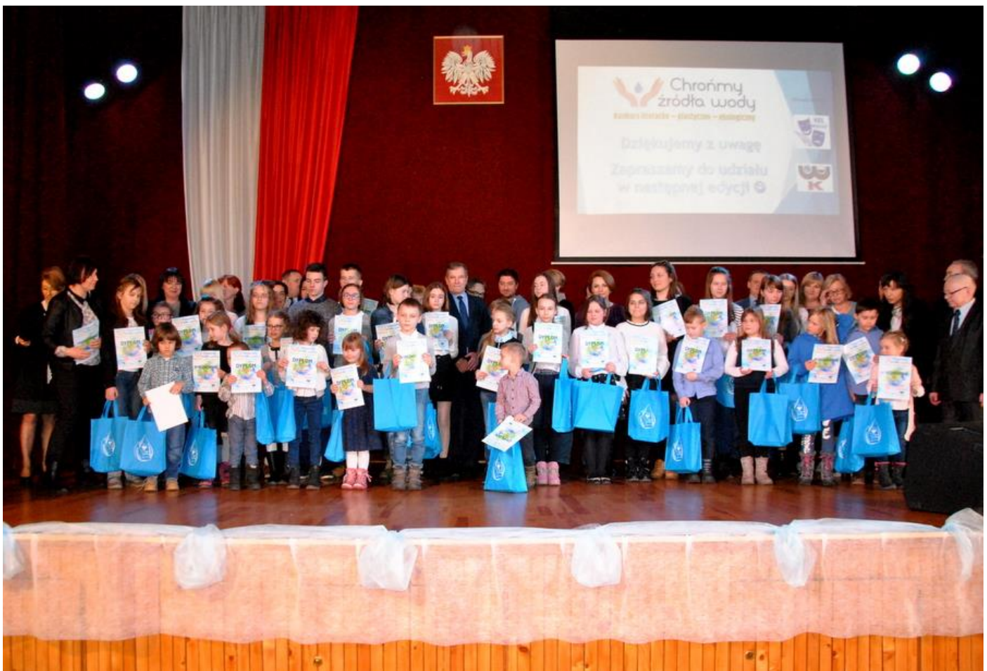
Fotografie autorstwa pana Piotra Kubiczka są częścią galerii zaprezentowanej na stronie internetowej Przedsiębiorstwa Wodociągów i Kanalizacji Sp. z o.o. w Olkuszu.