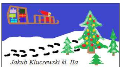
Jakub Kluczewski kl. IIa