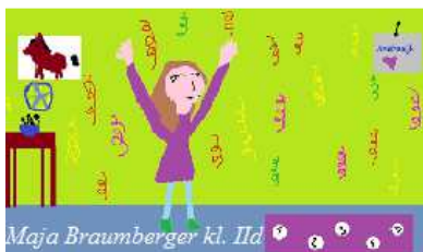
Maja Braumberger kl. IId