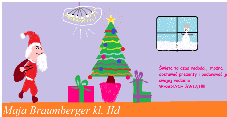
Maja Braumberger kl. IId