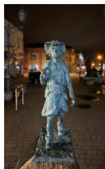
Ania Gamrot 8e