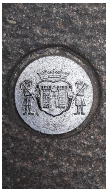
Nagroda - „Wejdiesz?”