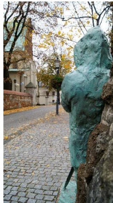
Oskar Spytkowski 4d