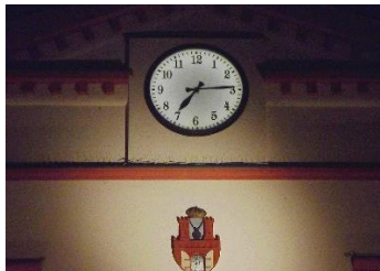
Kacper Broda Haras 7a