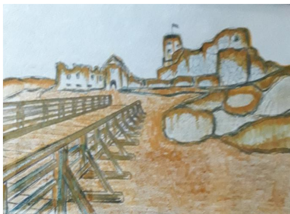
Leny Kasprzyk z 8d