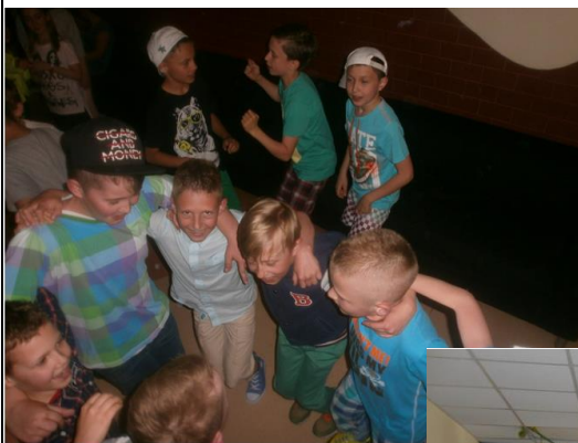
ZIELONA SZKOŁA – Jastrzębia Góra 2015