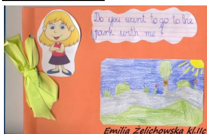
Emilia Żelichowska kl.IIc