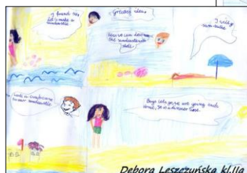
Debora Leszczyńska kl.IIa