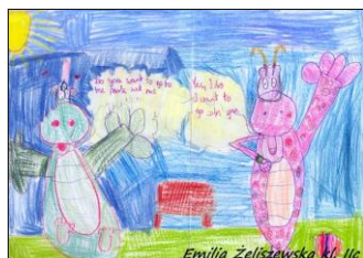
Emilia Żeliszewska kl. IIc